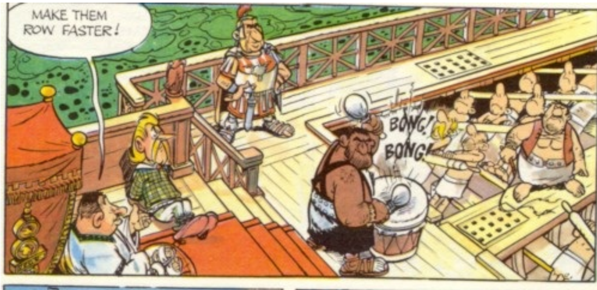
Figura 1.1. En este comic, que pertenece a la serie de Asterix (Gosciny y Uderzo), puede verse algo muy similar a la sincronización en una computadora. Los remeros se sincronizan a través de escuchar los golpes que se dan en el tambor. En caso de perder la sincronización se engancharían los remos y podrían romperse. En la historieta el romano a cargo del barco ordena que se aumente la velocidad, por lo cual el “percusionista” tendrá que acelerar el ritmo de golpeteo. Como consecuencia la frecuencia de sincronización será más alta (más hertz) y los pobres esclavos tendrán que remar más rápido.

Veamos la siguiente publicidad de las empresas INTEL y AMD (figuras 1.2 y 1.3) que son los mayores fabricantes de CPUs para las PCs (PC viene de Personal Computer, es decir Computadora Personal).